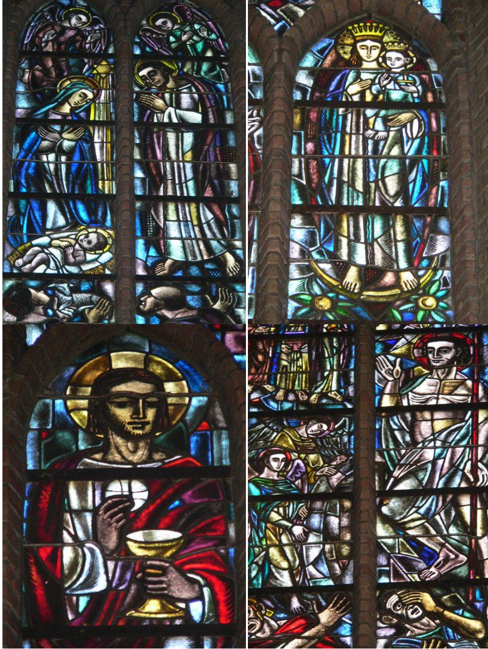
- enkele gebrandschilderde ramen van onze kerk